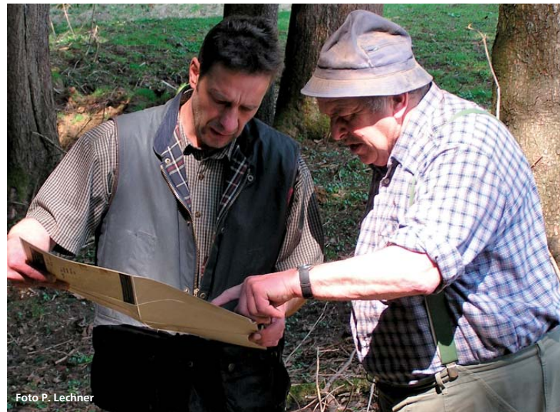
Abbildung 2: Ziel der forstlichen Beratung muss es sein, den Waldbesitzer für ein aktives Handeln in seinem Wald zu gewinnen. »Den Wald nutzen« heißt auch »den Wald schützen«.

Das Verfahren wird selbstverständlich nicht als Ersatz für das statistisch abgesicherte »Hegegemeinschaftsweise Gutachten« nach Art. 32 des Bayerischen Jagdgesetzes gesehen, sondern als dessen natürliche Ergänzung. Der Erfolg war und ist nachweislich sehr groß. Seit dieser Zeit wird in den Versammlungen der Jagdgenossenschaften anhand konkreter, revierbezogener Zahlen über das Thema Wildverbiss gesprochen. Das Zahlenmaterial und die forstfachlichen Aussagen sind nachvollziehbare, sachliche Grundlage für Revierbegänge und Dis-