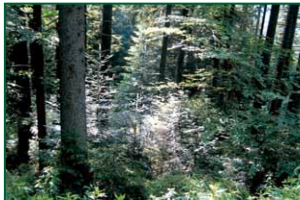
Naturnaher, leistungsfähiger Mischwald im Landkreis Miesbach

Seit mehr als 50 Jahren bewährt sich die Waldbesitzervereinigung Holzkirchen als Selbsthilfeeinrichtung der privaten und kommunalen Waldbesitzer. Schwerpunktaufgabe der WBV ist der Verkauf des Holzes im Auftrag der etwa 2000 Mitglieder. Zunehmend tritt die WBV aber auch als Dienstleister für alle Arbeiten im Bereich der Waldwirtschaft auf. Für Waldbesitzer, die ihren Wald entweder gar nicht selbst pflegen können, oder aber einfach keine Zeit dafür haben, bietet die WBV mit dem Waldpflegevertrag ein maßgeschneidertes Angebot.