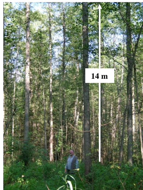
Die Qualität der Erle ist zwar sehr gut (14 m ohne Äste), die Krone ist aber zu klein