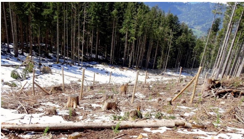
Neugebauter Weiserzaun am Schliersberg

Was kann die Naturverjüngung bei uns leisten, wie hilft uns die Natur beim dringend nötigen Waldumbau?