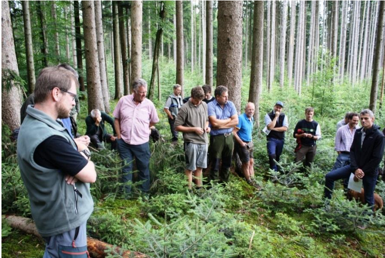
Waldbaulich-jagdliche Fachdiskussion inmitten reichlicher Weißtannenverjüngung im Bereich der Jagdgenossenschaft Valley I, Sommer 2019

Viele Jagdgenossenschaften in unserem WBV-Gebiet haben im Zusammenwirken mit ihren Jägern diesbezüglich Großartiges geleistet - auch und gerade im Sinne der Gesellschaft.