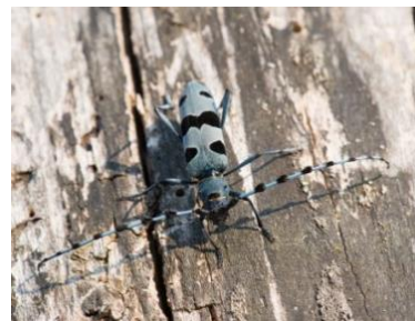
Alpenbock - streng geschützte Art! (Gero Brehm, AELF FFB)