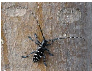
Asiatischer Laubholzbockkäfer

Die Bayerische Landesanstalt für Landwirtschaft (LfL) hat im August in Miesbach den Befall von Laubbäumen durch den Asiatischen Laubholzbockkäfer festgestellt. Der eingeschleppte Baumschädling ist besonders gefährlich, da er fast alle heimischen Laubbaumarten befallen und auch gesunde Bäume innerhalb weniger Jahre zum Absterben bringen kann.