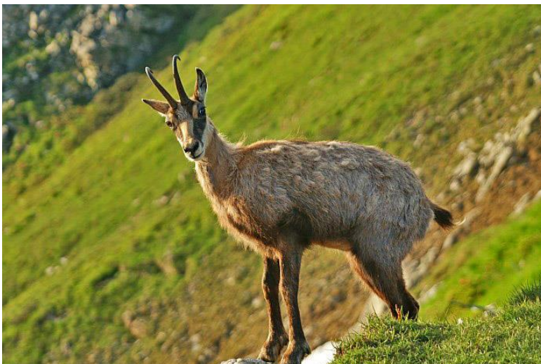
Gams im Alpenraum

Auswertung zeigt: Die regional dramatischen Schneemassen des letzten Winters lassen Winterverluste bei Gämsen nicht ansteigen