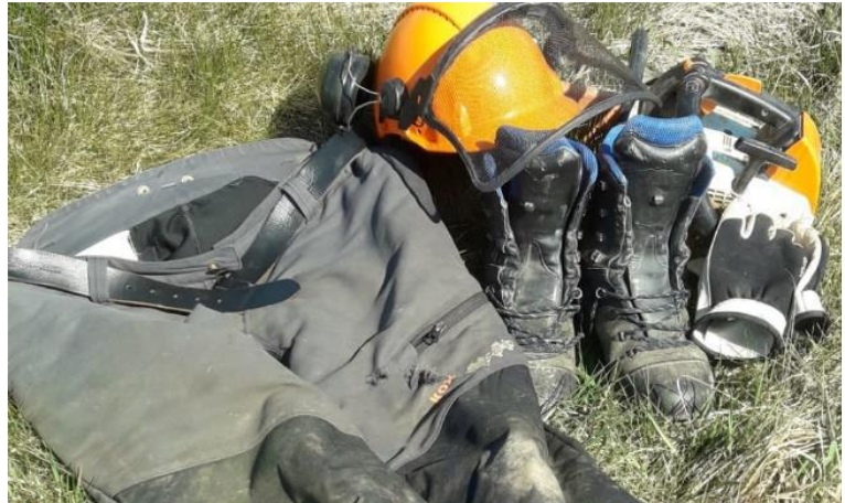
Persönliche Schnittschutzausrüstung

Bei allen Neuerungen, die es in der Waldarbeit in den letzten Jahrzehnten gab, zählt sie zweifellos zu einer der wichtigsten: die Schnittschutzhose. Ihre lebensrettenden Eigenschaften erhält sie durch Einlagen aus langen Kunststofffasern, welche bei einem Schnitt herausgezogen werden und sich dabei um das Antriebsrad wickeln und so die Kette in Sekundenbruchteilen zum Stillstand bringen. Auf dem Markt gibt es mehrere Schnittschutzklassen. Für den normalen Gebrauch im Wald ist Schnittschutzklasse 1 ausreichend, diese erhält man ab 60€. Die gesamte persönliche Schnittschutzausrüstung, bestehend aus Stiefeln, Hose, Helm und Handschuhen schlägt gerade einmal mit 150€ zu Buche. Nach einem Reinsägen muss die Hose immer ausgetauscht werden, da bei einem weiteren Schnitt die Schutzwirkung nicht mehr garantiert werden kann. Durch Dornen verursachte Risse in der Hose, welche nur den Oberflächenstoff verletzt haben, können sehr vorsichtig geflickt werden. Hierbei ist genauestens darauf zu achten, dass keine Fäden der Schnittschutzeinlage mit vernäht werden, da auch hier die Schutzwirkung verloren geht. Die Verwendungsdauer einer Schnittschutzhose hängt stark vom Gebrauch und dem Grad der Verschmutzung ab, die Hersteller geben hierzu in der Nutzerinformation einen Zeitraum an. Untersuchungen des Kuratoriums für Waldarbeit und Forsttechnik (KWF) haben ergeben, dass Hosen in einem guten Zustand bis zu 12 Jahre lang verwendet werden können.