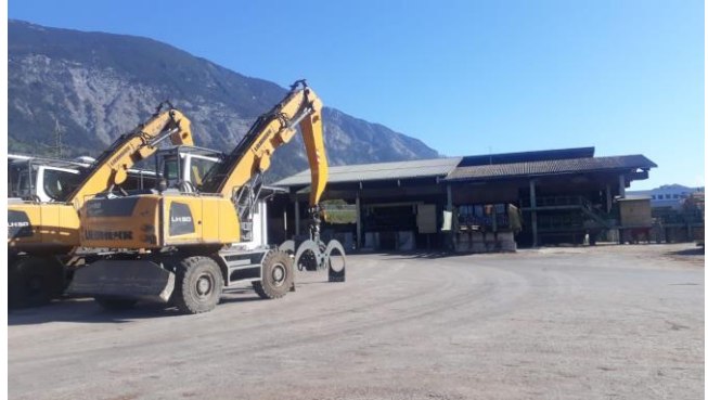
Stillstand beim Sägewerk Troger: leere Holzannahme

Die sogenannte „Corona-Krise“ macht auch vor der Sägeindustrie und damit vor dem Rundholzmarkt nicht halt. Nachdem im Januar noch eine verhalten anziehende Nachfrage nach Lang- und Kurzholz zu vermelden war, spitzte sich im Zuge der Verschärfung der Coronakrise auch die Lage der rundholzverarbeitenden Betriebe immer mehr zu. Die Folgen waren deutlich und zeigten sich in immer schnelleren Preisrücknahmen im Februar und März sowie nochmal im April. Insbesondere als in Italien auch alle Betriebe in Industrie und Handwerk geschlossen wurden, konnten die Schnittholzprodukte aus Österreich und Deutschland nicht mehr dorthin exportiert werden. Darauf folgten ähnliche Maßnahmen in Österreich und anderen europäischen Ländern. Besonders die Stillstände in der italienischen und österreichischen Bauindustrie forderten ihren Tribut. Die bayerischen und österreichischen Sägewerke fuhren Schritt für Schritt ihre Produktion zurück. Teilweise wurden Betriebe zeitweise ganz geschlossen und sind es bis heute. Entsprechend reduzierten sich die möglichen Abnahmemengen.