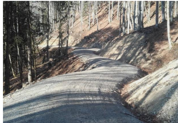
Bereit für die Waldpflege: Der neue „Kühzaglweg“ schlängelt sich durch steiles Gelände am Baumgartenhang

Die Holznutzung und Waldpflege war für die Waldbesitzer am Baumgartenhang bislang kaum möglich. Es fehlte die Grundvoraussetzung für eine pflegliche Nutzung der Wälder: Die Erschließung durch eine Forststraße. Nun aber ist der etwa 2,5 km lange „Kühzaglweg“ nach knapp drei Jahren Bauzeit zur Benutzung freigegeben. Mit Hilfe von Forstseilbahnen können so auf Dauer über 180 Hektar Bergwald nachhaltig bewirtschaftet und gepflegt werden. Der Wegeneubau im Privatwald wurde über den zuständigen Revierleiter des AELF Holzkirchen, Hans Feist, organisiert und über die Forstverwaltung bezuschusst