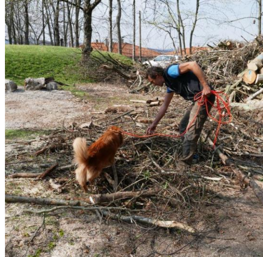
ALB-Spürhund im Einsatz

Die Bekämpfung im sog. „Hallenwald“ ist eine anspruchsvolle und alles andere als alltägliche Aufgabe für die Arbeiter. Auf engem Raum mitten in der Bebauung sind teilweise schwere Buchen mit ausladenden Kronen, Ahorne oder Birken sicher zu Fall zu bringen. Baumkletterer kürzen vor der seilgesicherten Fällung das Astwerk ein, damit die fallenden Bäume am verbleibenden Bestand möglichst wenig Schäden verursachen. Mit einem Schreitbagger können im Hang Bäume mit