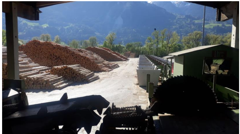
Leere Sortierboxen und ein gut gefüllter Lagerplatz.

Verstärkt wurde diese negative Entwicklung durch die Folgen des Sturmtiefs Sabine und der lokal folgenschwereren Nachfolgestürme Bianca und Yulia im Februar. Mancherorts sorgten sie für beträchtliche Mengen an Sturmholz, was sich insbesondere in den Gebirgslagen jetzt erst zeigt. Diese außerplanmäßigen Holzmengen belasten zusätzlich den Markt. Darüber hinaus erschwert die Schließung kleinerer Grenzübergänge, Rundholz in noch abnahmebereite, kleinere Betriebe zu liefern. Unsere heimischen Bauholzsäger nahmen alles in allem die vereinbarten Vertragsmengen an Langholz ab, können zurzeit jedoch keine Hinweise geben, wie es in naher Zukunft weitergeht. Aktuell sind weder beim Langholz, noch beim Kurzholz, Verhandlungen auf Augenhöhe möglich. Die Preise werden von den noch wenigen