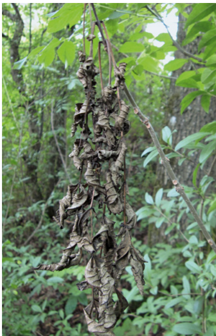
3. Abgestorbene Blätter, die nicht aktiv abgeworfen werden können