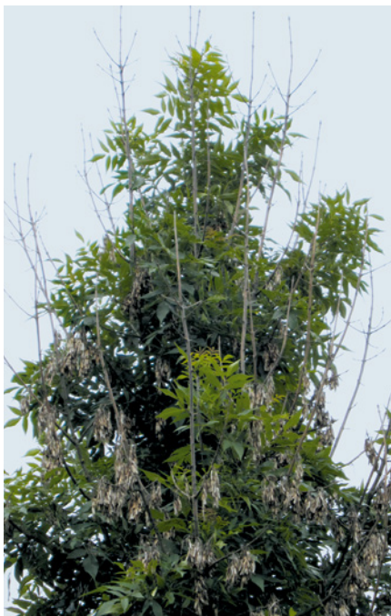
4. Abgestorbene Triebe in der Lichtkrone einer etwa 10-jährigen Esche