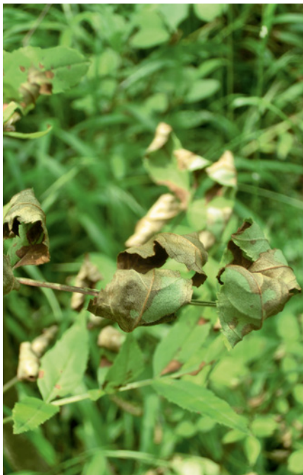
1. Verfärbte Blätter

Unregelmäßige Farbveränderungen an den Blattspreiten der Fiederblätter (Bräune) zeigen eine erste Infektion (vgl. Abbildung 1). Zeitlich deutlich verzögert werden dann beige-braune bis orange-braune Rindennekrosen an den Trieben sichtbar, die im unbelaubten Zustand sehr deutlich zu erkennen sind (vgl. Abbildung 2). Das Holz unterhalb dieser Nekrosen ist blau-grau bis dunkelbraun verfärbt. Diese Holzverfärbung ist allerdings nicht auf den Bereich der Nekrose beschränkt, sondern setzt sich ober- und unterhalb fort. Die Rindennekrosen können bereits im Herbst des Infektionsjahres oder auch erst im folgenden Frühjahr erkennbar werden. Triebumfassende Nekrosen unterbrechen die Wasserversorgung des Astes, so dass Pflanzenteile oberhalb der Nekrose welken und absterben (vgl. Abbildung 3). Da zu diesem Zeitpunkt noch keine Trennungszone ausgebildet wird, bleiben die Blätter noch längere