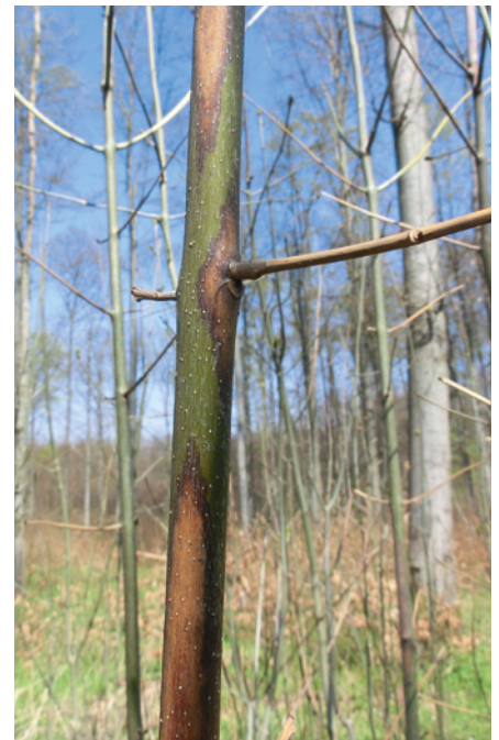
2. Rindennekrosen und abgestorbener Trieb