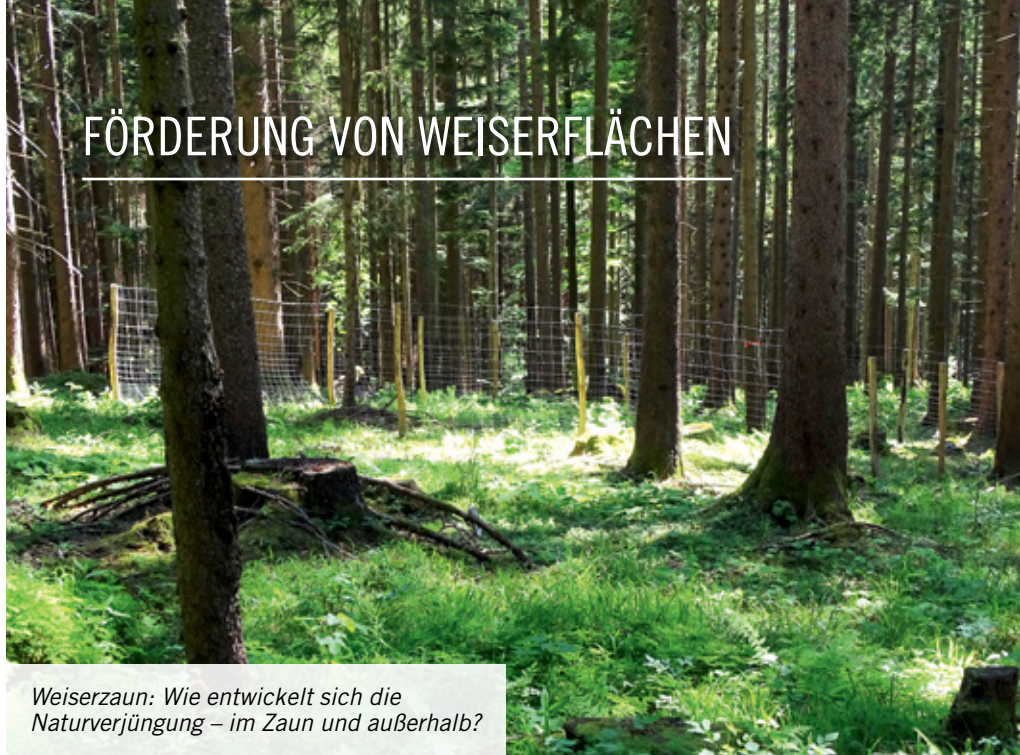
Weiserzaun: Wie entwickelt sich die Naturverjüngung – im Zaun und außerhalb?

Um unsere Wälder ohne Schutzmaßnahmen verjüngen zu können, ist eine gute Zusammenarbeit zwischen Waldbesitzern, Jagdgenossenschaften, Förstern und Jägern notwendig. Im Landkreis Miesbach haben sich die „Revierweisen Aussagen“ bereits seit fast vierzig Jahren als Diskussionsgrundlage für die objektive Beurteilung der Situation der Waldverjüngung in den Jagdgenossenschaften bewährt. Ergänzend ist die Anlage von Weiserflächen bei gleichzeitiger Durchführung regelmäßiger Revierbegänge geeignet, die Zusammenarbeit auf Jagdrevierebene zu stärken.