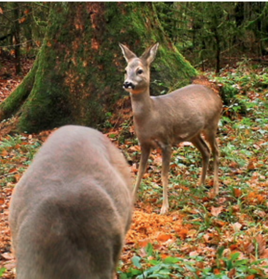
Für das Rehwild wird dieses Frühjahr wieder ein 3-Jahresabschussplan erstellt

Die Jagdgenossenschaften arbeiten mit ihren Pächtern oder Angestellten Jägern in diesem Frühjahr bayernweit einen Vorschlag zur Abschusshöhe in den jeweiligen Jagdrevieren aus. Bei unserer wichtigsten Schalenwildart, dem Rehwild, gilt der Abschussplan für die nächsten drei Jahre. Wichtige Entscheidungshilfe ist das „Forstliche Gutachten zur Situation der Waldverjüngung“ und besonders die „Revierweisen Aussagen“. Letztere geben eine klare Aussage zur Verbissituation im einzelnen Jagdrevier. Den Jagdgenossenschaften, wie auch den Jagdpächtern, wurden die Forstlichen Gutachten über die Unteren Jagdbehörden bereits zugestellt.