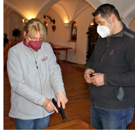
Die korrekte Waffenhandhabung will gelernt sein.

Unsere Informationsveranstaltung zum Jagdkurs 2022/2023 findet am Freitag, den 08. April 2022, 19.30 Uhr beim Neuwirt in Hartpenning statt. Alle Interessenten sind herzlich eingeladen. Eine vorherige Anmeldung ist nicht nötig. Bitte beachten Sie die gültigen Corona-Vorschriften.