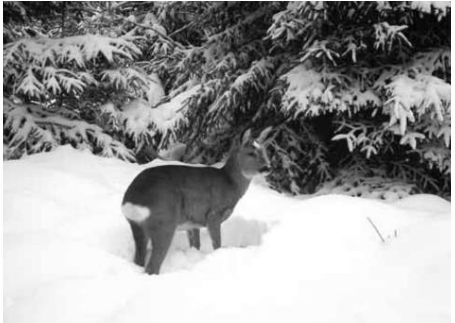
Unser heimisches Rehwild ist auch an hochwinterliche Verhältnisse bestens angepasst

Die Jagdzeit für Rehböcke endet am 15. Oktober, die für weibliches Wild und für Kitze am 15. Januar. Diese Regelung unterschiedlicher Jagdzeiten beim Rehwild geht zu Lasten vor allem der Effizienz der herbst- und winterlichen Bewegungsjagden, da die Schützen stets fürchten müssen, versehentlich einen Rehbock zu erlegen, der zu dieser Jahreszeit kein Geweih mehr trägt. Aufgrund einer Entscheidung von Staatsminister Helmut Brunner wird der fahrlässige Abschuss von Rehböcken ab dem Jagdjahr 2013/14 nun grundsätzlich nicht mehr verfolgt. Die Unteren Jagdbehörden bekommen entsprechende Weisungen. Damit wird einer wichtigen jagdpolitischen Forderung unter anderem der WBV und des Bayerischen Waldbesitzerverbandes entsprochen.