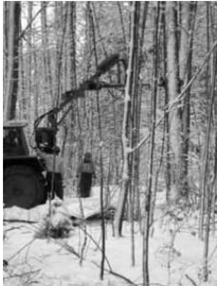
Der Baumrüttler in Aktion

Geerntet wurde mit einem Baumrüttler der an einem Schlepper montiert ist. Das Saatgut fällt auf eine Plane, wobei jahreszeitlich bedingt natürlich auch jede Menge Schnee dabei war. Zur weiteren