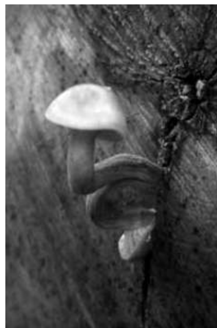
Pilzfruchtkörper an der Stirnseite eines Bergahornstammes am Submissionsplatz

Wichtig ist weiterhin, Einschlagsmaßnahmen rechtzeitig zu planen, anzumelden und zeitnah durchzuführen sowie auf die entsprechende vertragliche und finanzielle Absicherung zu achten. Die WBV bietet die entsprechenden Absicherungen. Deshalb informieren Sie uns - Holzvermittler, Einsatzleiter bzw. die WBV-Geschäftsstelle – über Ihre Vorhaben. Wir beraten Sie gerne unverbindlich und kostenlos bezüglich Dienstleistung, Aushaltung der Sortimente sowie Verkauf des Holzes und bieten Ihnen die entsprechende vertragliche Absicherung. Das gilt vor allem jetzt für die in den kommenden Monaten schwerpunktmäßig stattfindende Bergholzernte. Nutzen Sie das Dienstleistungsangebot Ihrer WBV Holzkirchen. Unsere Mitarbeiter/innen stehen Ihnen gerne zur Verfügung.