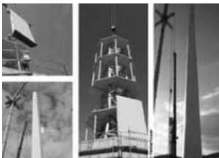
Der Aufbau des „Timbertower“

abtragung der 100 Tonnen schweren Gondel erfolgt ausschließlich über die 30 cm dicken Sperrholzwandungen. Bei der späteren Serienfertigung sollen Aufbau und Montage nur 10 Tage dauern. Ein Turm mit einer Nabenhöhe von 140 Metern ist bereits in Entwicklung. Nähere Informationen unter www.timbertower.de