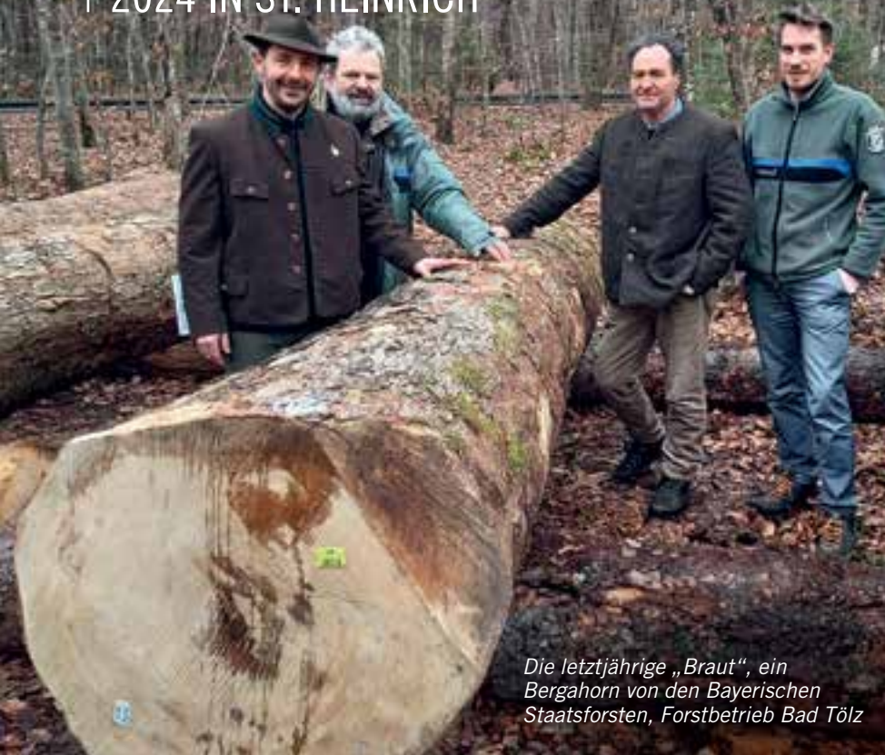
Die letztjährige „Braut“, ein Bergahorn von den Bayerischen Staatsforsten, Forstbetrieb Bad Tölz

Die Vorbereitungen zur Submission 2024 laufen gerade wieder an. Gesucht sind alle Holzarten in guter bis hervorragender Qualität und entsprechender Dimension (Laubholz ab 40 cm Stärke, Nadelholz ab 50 cm), Raritäten wie Ulme, Obstholz etc. sind auch in schwächerer Dimension gesucht. Der Einschlag und die Anmeldung der Stämme sollten bis Ende November abgeschlossen sein.