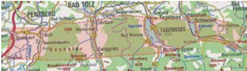
Schwerpunkte der Hagelschäden im Oberland

Das Hagel-Unwetter vom 26. August 2023 beispielsweise hat einen Korridor von Sindelsdorf bis zum Wendelstein besonders stark betroffen (siehe nachfolgende Karte). Bitte kontrollieren Sie in diesem Bereich Ihre Waldflächen besonders intensiv auf Hagelschäden.