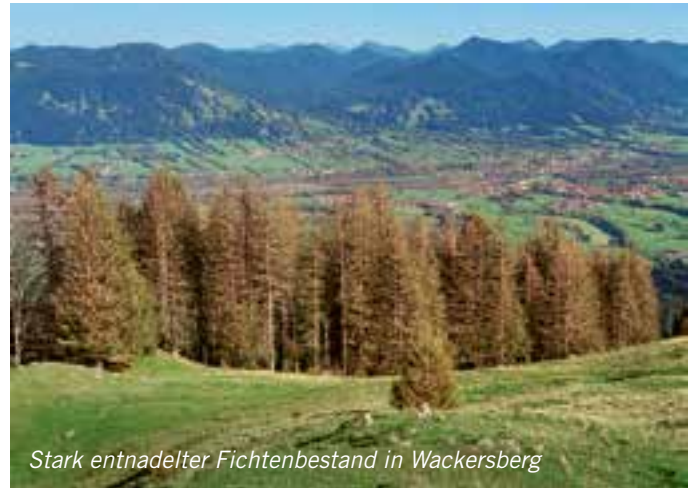
Stark entnadelter Fichtenbestand in Wackersberg

ab dem kommenden Frühjahr anfällig für Borkenkäferbefall. Darüber hinaus haben die Erfahrungen gezeigt, dass stark geschädigte Fichten so geschwächt sind, dass sie oft im nächsten Jahr absterben.